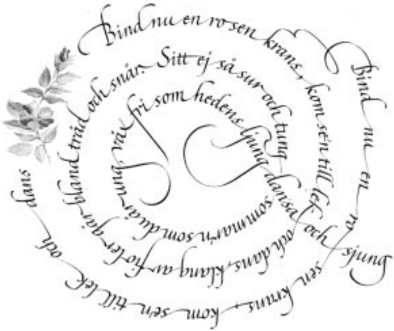
Kursiven som jag själv vill ha den, 1986.